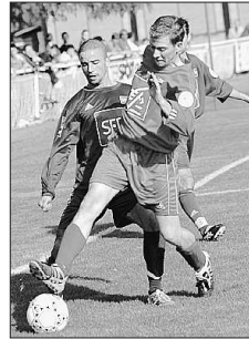
Les Marnavalais feront en sorte de faire plaisir à leurs supporters.

F. R. : «Certains joueurs sont revenus de vacances plus tard que d'autres et sont donc un peu en dessous. Je pense que nous sommes entre 70 et 80% de nos capacités.»