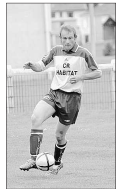
Les Eclaronnais-Valcourtois s'attaquent à un gros morceau.