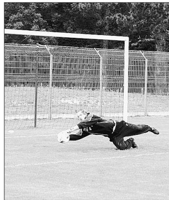
Pour la rencontre face à Ben Hamanne et les Langrois, Humblot, le gardien du CFC, touché au mollet, est incertain.