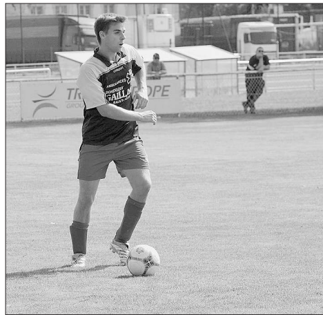
Une réaction s'imposait. Sans être géniaux en défense, les Marnavalais sont parvenus à s'imposer.