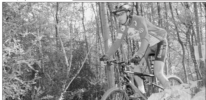
Les Vététistes seront au paradis, demain, à Chaumont.

ra sûrement d'apposer une nouvelle fois sa griffe, tandis que Jean-Paul Stephan, dans son bel écrit arc-en-ciel, tentera peut-être l'escapade en solitaire, comme l'an dernier. Révélateurs : d'un véritable engouement actuel pour le VTT, ces 6 Heures du Pays Chaumontais font suite aux 4 Heures de Joinville, qui s'étaient tenus au début de l'été. Indépendantes l'une de l'autre, ces deux épreuves pourraient, pourquoi, envisager un rapprochement en vue d'un mini-championnat ? Cela n'est pas (encore) à l'ordre du jour mais, l'idée mériterait de faire son chemin. Car il semble vraiment qu'en Haute-Marne, le VTT ne demande qu'à prendre son envol.