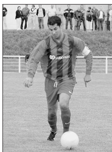
Pour Laassiri et le COL, la victoire est impérative.