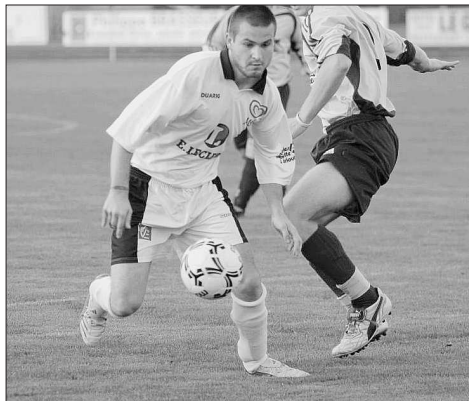
Les Bragards ont une place de leaders à défendre.